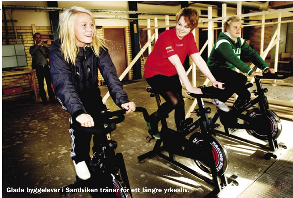
Glada byggelever i Sandviken tränar för ett längre yrkesliv.

Målsättningen är att öka elevernas insikt om betydelsen av träning och bra kost för att behålla en god hälsa. Är man någorlunda bra tränad så ökar chansen att undvika belastningsskador högst betydligt. Innan projektet satte igång så testades eleverna av läkare och specialister från det näraliggande bandygymnasiet i Sandviken.